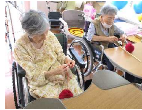
リハビリ室での様子