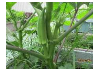
ゆうゆう村菜園 スイカ、オクラ、キュウリ、メロン、シソ等収穫出来ました♡♡